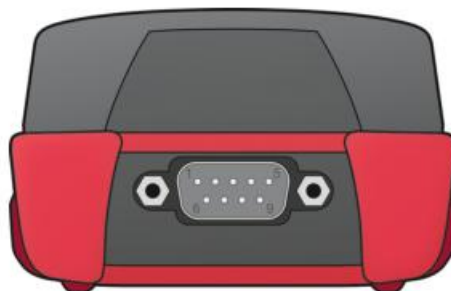
Figure 4: D-Sub connector of the PCAN-MiniDiag FD at the rear of the housing.